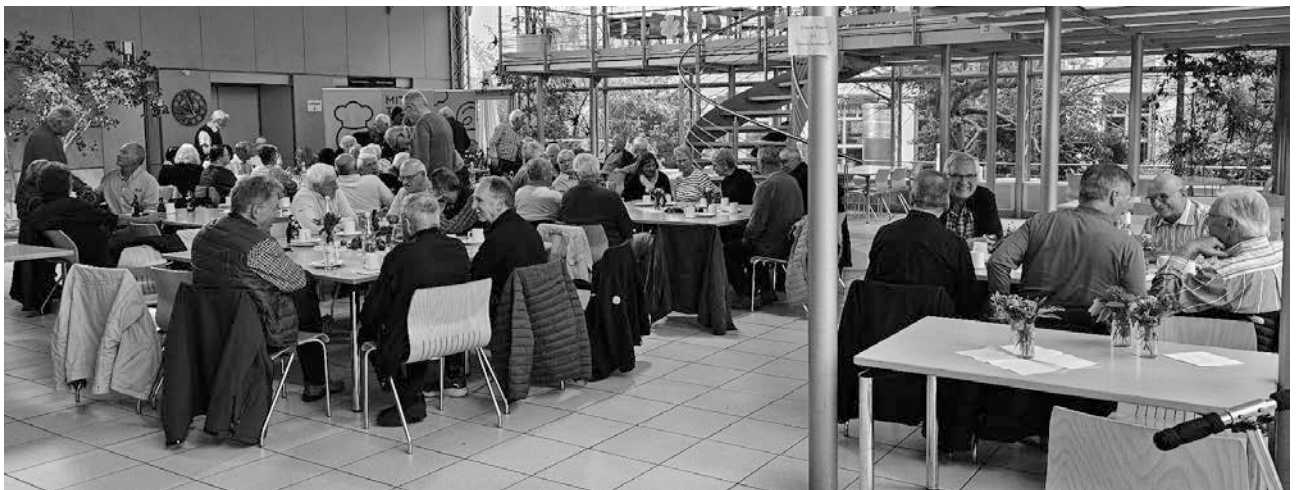
Gute Stimmung bei herbstlich gedeckten Tischen im Telekom-Kasino